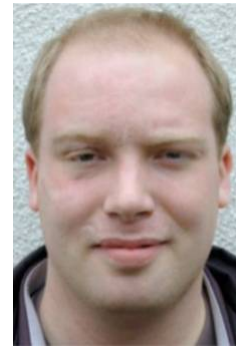
de Serge 2001 op der T3CM