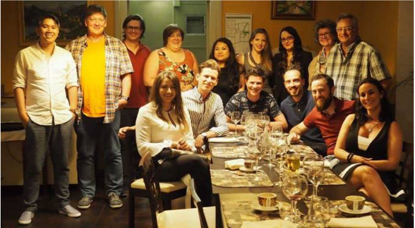
SchülerInnen vun den zwou T3CM-Klassen aus de Joeren 2007-2008 hu sech den 27. Mee 2017 am Restaurant „La Croccante“ zu Mamer erëmgesin.