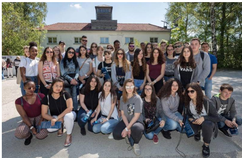
Les élèves des classes de 4e, 10e et 11e du LTMA à Dachau

Eng 40 Schüler vu verschiddene Klassen (10 e , 11 e a 4 e ) aus dem LTMA sin gutt zu Dachau u-komm. Wei och scho während de vergaangene Jore wäerten eis Schüler d'Konzentrationslager vun Dachau besichen a sech mam Thema 'Holocaust' beschäftegen.