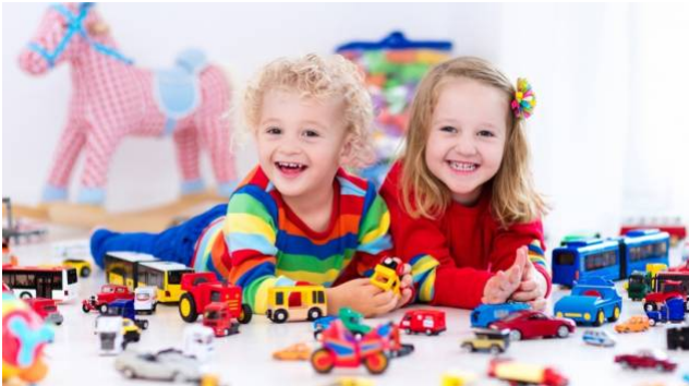
Stereotype kënnen de Bildungsprozess vu Meedercher a Jongen aschränken

"Jonge sinn net sou fläisseg a stéiere méi heefeg an der Klass, Meedercher si schei a roueg." Dat si Stereotypen, déi op enger rezenter Diskussiounsronn an der Abtei Neimënster ënner d'Lupp geholl goufen. Stereotype kënnen de Bildungsprozess vu Schüler ëmmer nach aschränken.