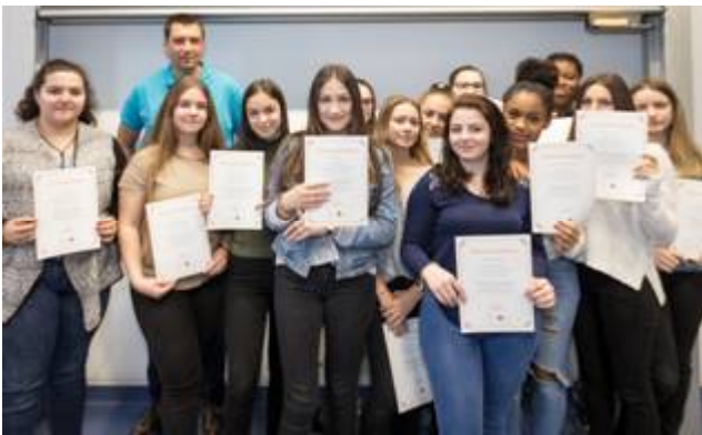
Die 10SN1 des „Lycée technique Mathias Adam“

Im Rahmen der Neugründung des „Zentrum für politesch Bildung“ haben zahlreiche Luxemburger Grund- und Sekundarschulklassen an einem weltweiten Schülerwettbewerb teilgenommen. Ziel ist es, dass Schüler sich mit aktuellen politischen Themen auseinandersetzen.