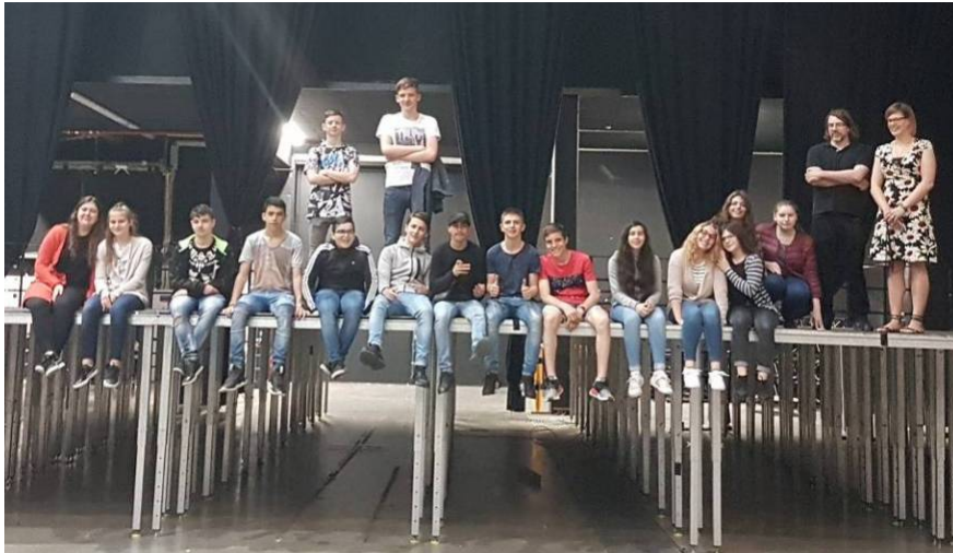
Eng interessant Visite an der Rockhal haten d'8Mo2 an d'8Mo4

https://www.facebook.com/Ltma.lu/photos/pcb.1172084106252824/1172083946252840/?type=3&theater